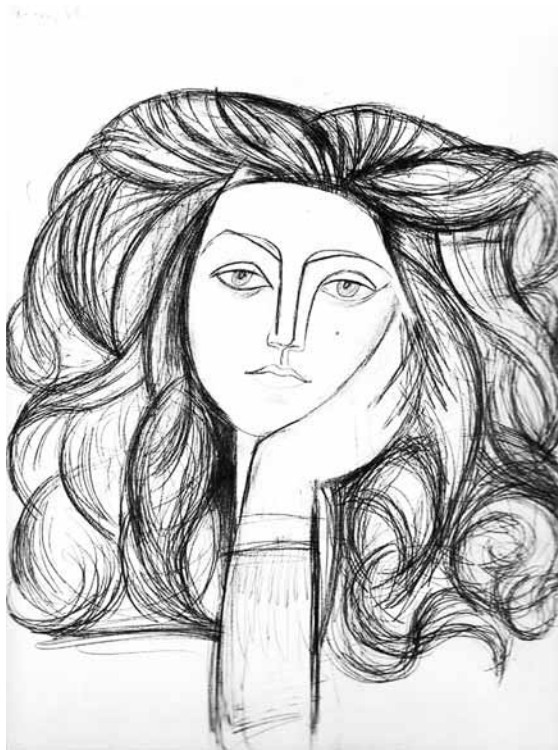
Pablo Picasso, Retrato de mujer