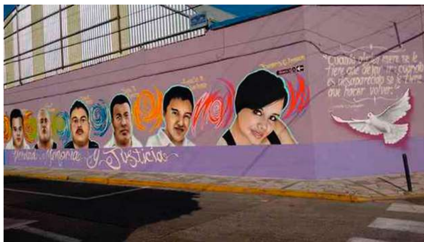
Imagen 4. Segundo mural en la primaria Agustina Ramírez en la calle Oriente 10 de la ciudad de Orizaba, Veracruz.

El segundo mural se pintó en la Primaria Agustina Ramírez de la misma ciudad de Orizaba, en las calles Oriente 8 y Oriente 10. La conveniencia de dicho espacio tenía relación con la facilidad para usar la pared, lo céntrico del lugar y la gran afluencia de personas que podrían verlo (Del Palacio y Torres, 2020, p. 211).