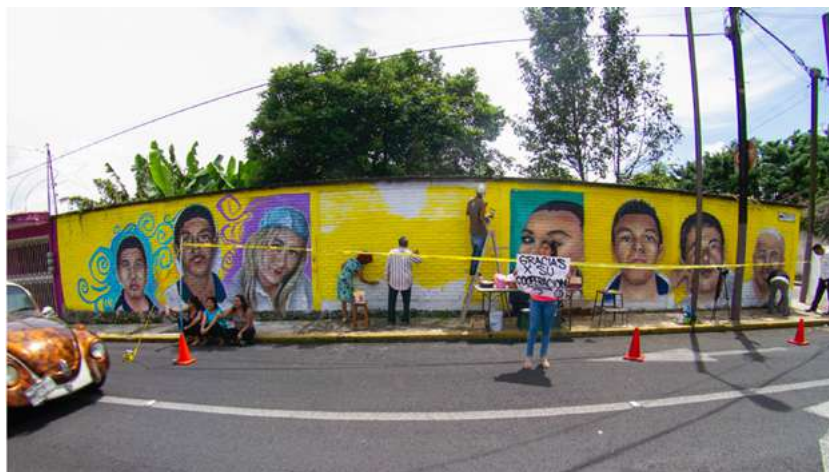
Imagen 3. Pinta del primer mural en la calle Oriente 5 de Orizaba, Veracruz.