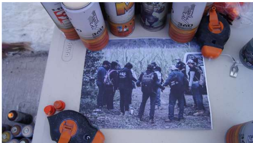
Imagen 2. Fotografía utilizada para la pinta del mural en la calle Norte 3 de Orizaba, Veracruz. Los miembros del colectivo en Campo Grande realizando una oración antes de comenzar la jornada de búsqueda. (Fuente: Archivo personal).

Cabe destacar como último punto de este apartado, la etapa de exhumación, que a nivel emocional es una de las que más impacto genera sobre los familiares que observan cómo son extraídos los restos de las personas desaparecidas. Incluso para integrantes con experiencias previas de índole forense, este momento resulta sumamente intenso: