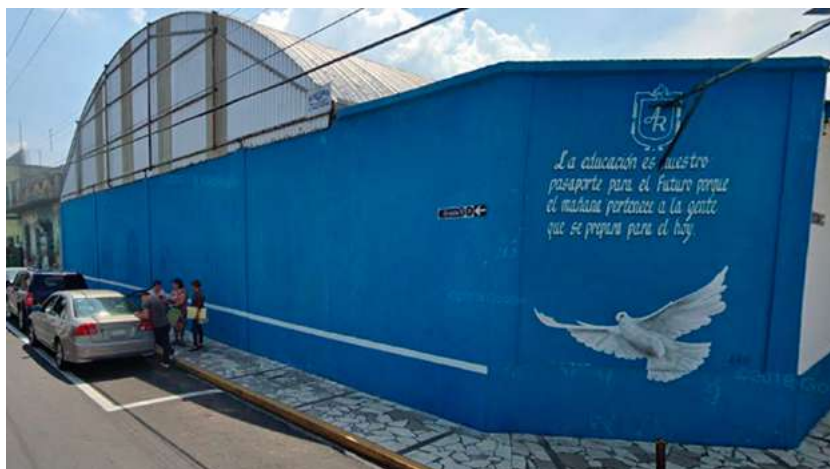
Imagen 5. El mural borrado en la primaria Agustina Ramírez.

Por lo anterior, el mural sería borrado pero no en su totalidad, se conservaría la paloma blanca y se escribiría una leyenda que dice: “La educación es nuestro pasaporte para el futuro porque el mañana pertenece a la gente que se prepara para el hoy”. El hecho de conservar un elemento del mural original, apropiárselo, resinificarlo y dar un mensaje totalmente diferente puede entenderse como un acto profundamente agresivo y considerarse “un contragolpe en la arena pública en la lucha por las memorias colectivas” (Del Palacio y Torres, 2020, p. 220).