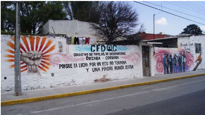
Imagen 7. Mural en la calle Norte 3 de Orizaba. (Fuente: Archivo personal).

aquí estamos y esto es parte de lo que hacemos –continúa diciendo Norma Alvarado– En lo del círculo, donde estamos haciendo oración, es que se dio eso porque pues la verdad que no se había dado un encuentro de restos tan grande como el de Campo Grande, entonces como que se necesitaba como plasmar ¿no?, el trabajo que se estaba haciendo, y por eso fue, sí, y fuimos y ahí estuvimos (Alvarado, 2021-09-22).